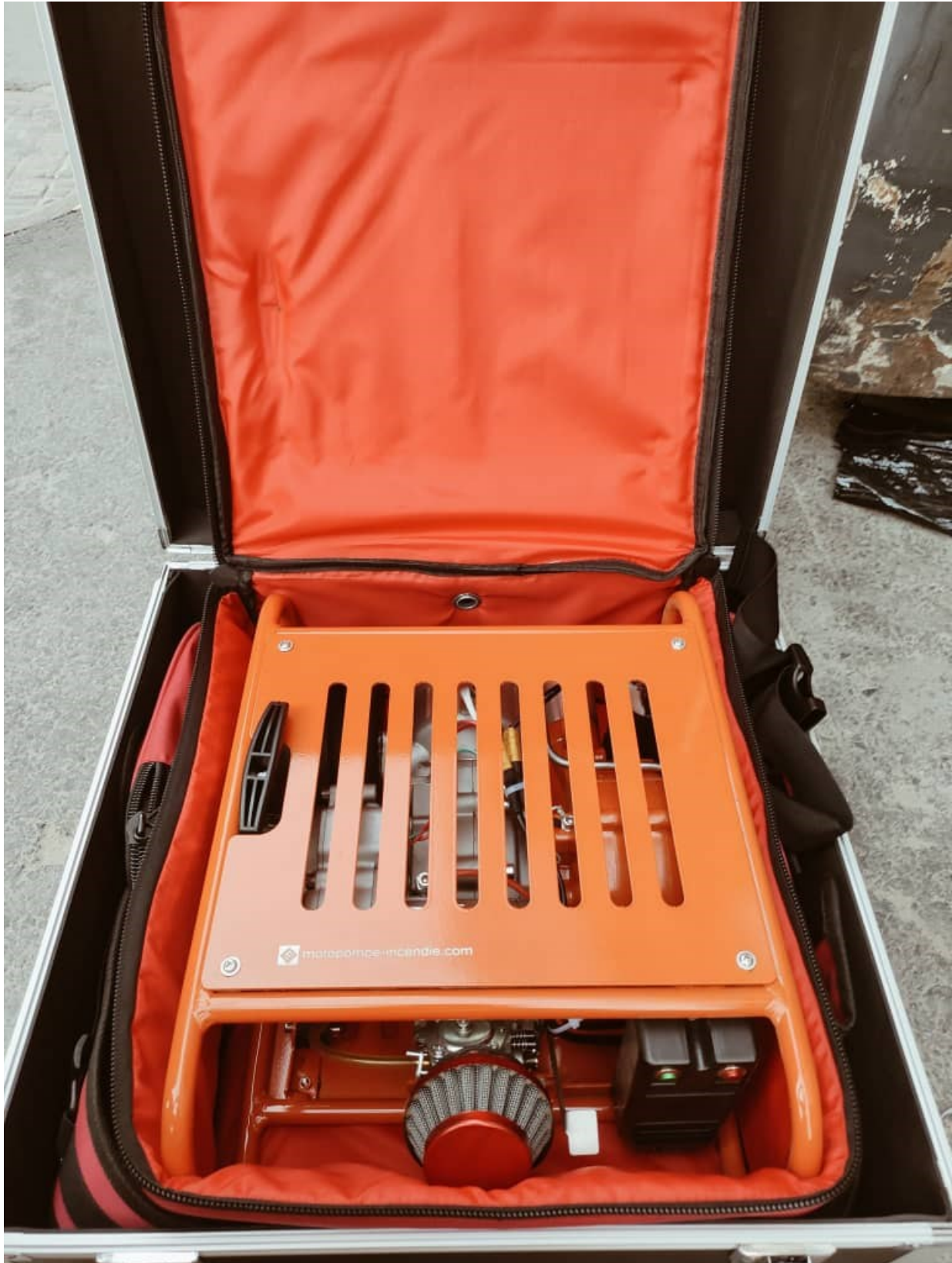
Claie de portage souple + caisse de transport véhicule