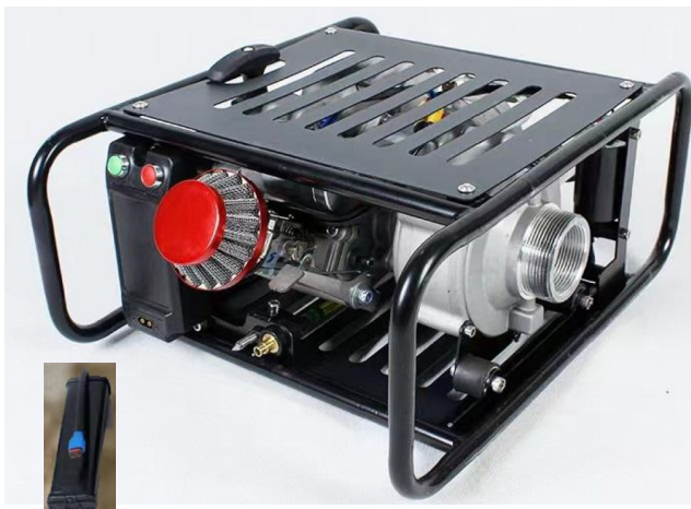
Démarrage manuel et électrique par bouton-poussoir et batterie externe type power bank