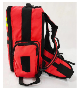
Sac à dos portage motopompe