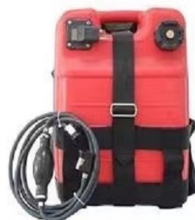
Réservoir carburant 12 ou 24L