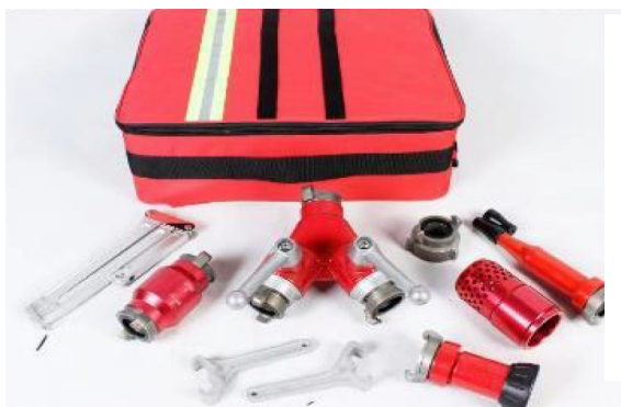
Sac à dos portage accessoires